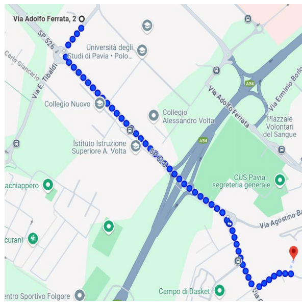
Cammino a piedi Palazzina INFN - LENA